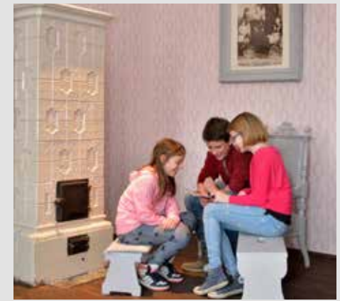
Schiele Wohnung am Bahnhof mit originalem Kachelofen

Garten Tulln: ab 8. April Ermäßigter Eintritt mit Egon Schiele Museum-Ticket täglich 9:00 bis 18:00 Uhr diegartentulln.at