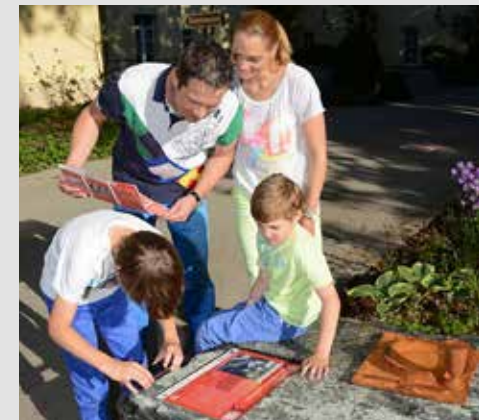
Schiele Weg Station