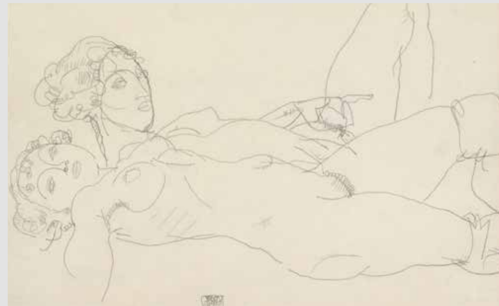
Egon Schiele, Zwei liegende Mädchenakte (1914) Peter Infeld Privatstiftung

The current exhibition, " Egon Schiele. Gazes ", explains how Schiele looked at different topics, but also explores the significance of eyes in the artist's portraits.