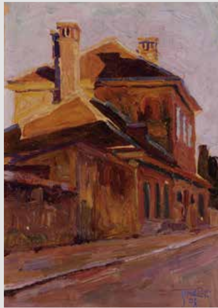
Egon Schiele, Haus in Oberdöbling (1908) Landessammlungen NÖ, KS-1916-1

An der Seite Alessandra Cominis führt ein Pfad zu Schieles Lebensstationen. Schließlich werden Ereignisse von jenen Menschen erzählt, die Schiele begleitet haben. Möglich machen das Interviews,