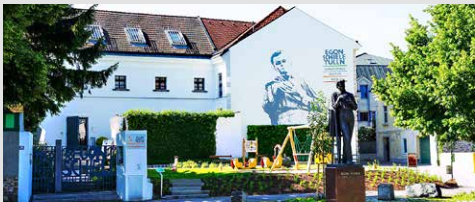
Egon Schiele Museum Tulln, Donaulände 28