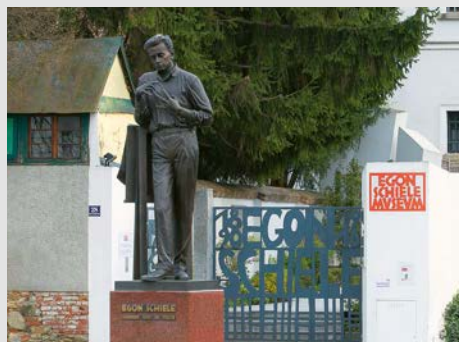
Egon Schiele Museum Tulln