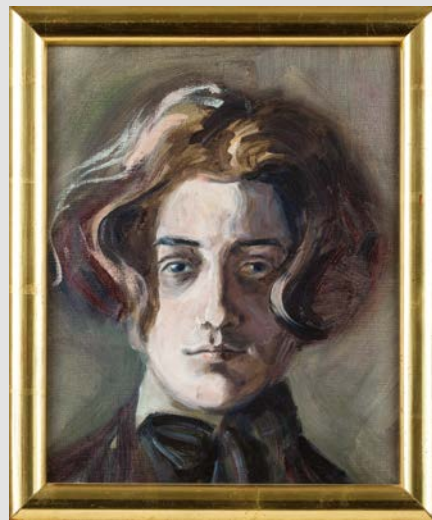
Selbstbildnis mit langem Haar, 1907 © Privatbesitz

Das Jahr 1918 ist in vielfacher Hinsicht ein Gedenkjahr. Unter anderem ist es der 100. Todestag des international umjubelten Jahrhundertkünstlers Egon Schiele.