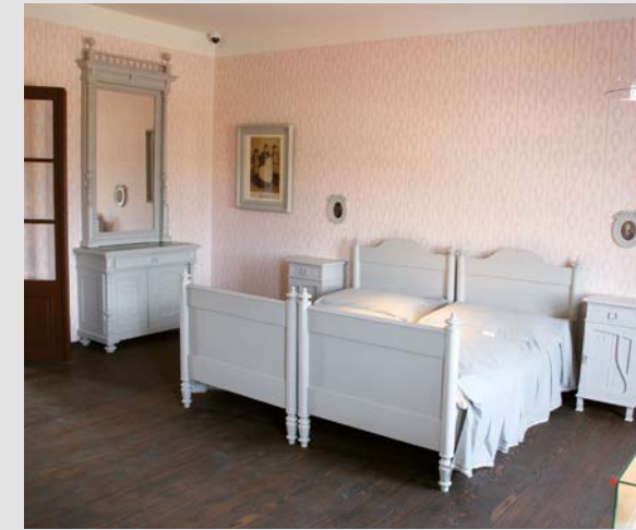
Egon Schiele Geburtshaus