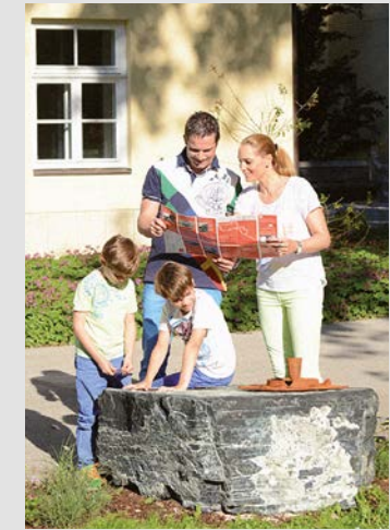
Egon Schiele Weg