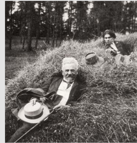
Leopold Czihaczek und Egon Schiele um 1907

hinter einer Scheibe. Oder ist es doch keine Scheibe? Wir betrachten den Raum über einen Monitor, auf dem ein Film zu sehen ist. Darin erzählt Frau Comini, wie all das zusammenhängt.